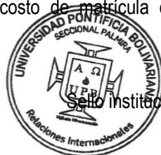
Responsable del Programa Firma

El presente documento goza de presunción de autenticidad y tendrá valor probatorio ante cualquier reclamación. Se ofrecen las siguientes plazas bajo el total conocimiento de las condiciones y requisitos estipulados por la convocatoria. Se recuerda que se exonera el costo de matrícula en destino. No se podrán generar cobros administrativos y académicos adicionales.